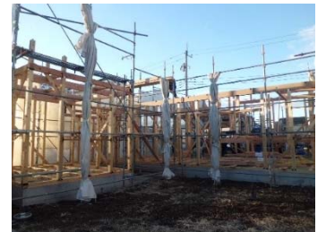
平屋の家を建てています